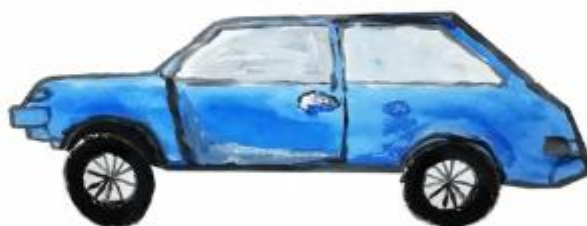
Новикова Дарья - Ласточка